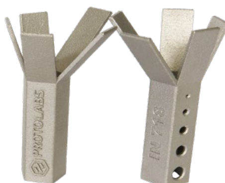
Résolution normale 60 µm