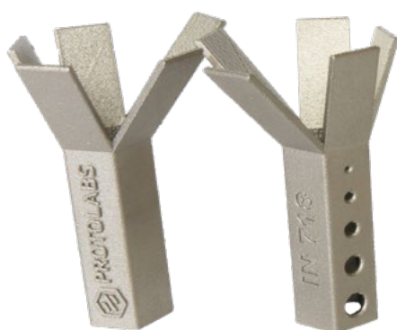
Haute résolution 50 µm